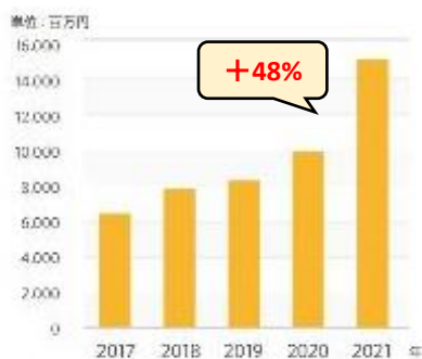
国内アーモンドミルク販売金額